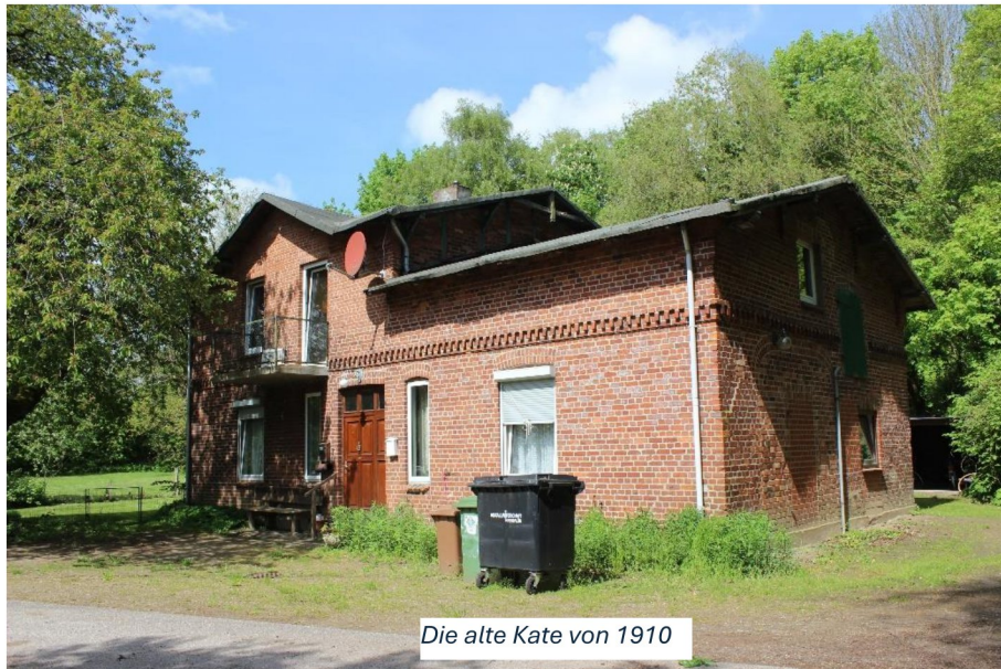
Die alte Kate von 1910