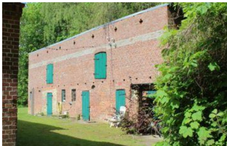
Rechte Seite für die Kühe, linke für das Pferd und die Schweine