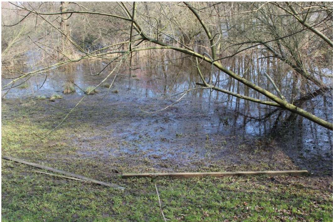
Unser Garten im März 2024