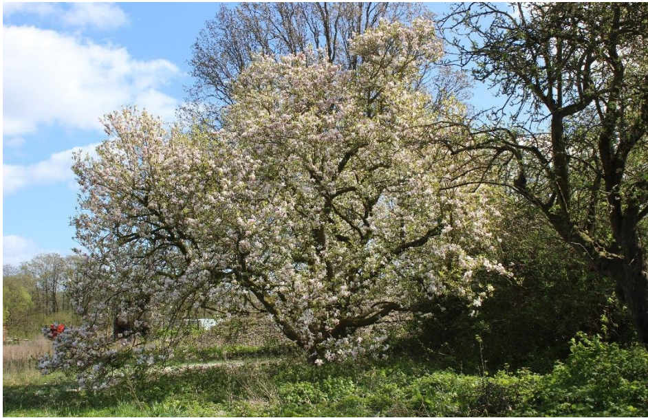
Blühende Magnolie auf dem Gelände des ehemaligen Dörnicker Hofes