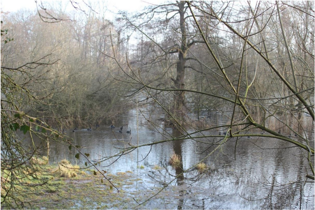
Unser Garten im Januar 2024

Im letzten Dezember verwandelte sich unser Garten in einen Wassergarten. Erst ab Mai kann man weitgehend trockenen Fußes darin unterwegs sein. Ungewöhnlich lange hat die Vernässung diesmal gedauert.