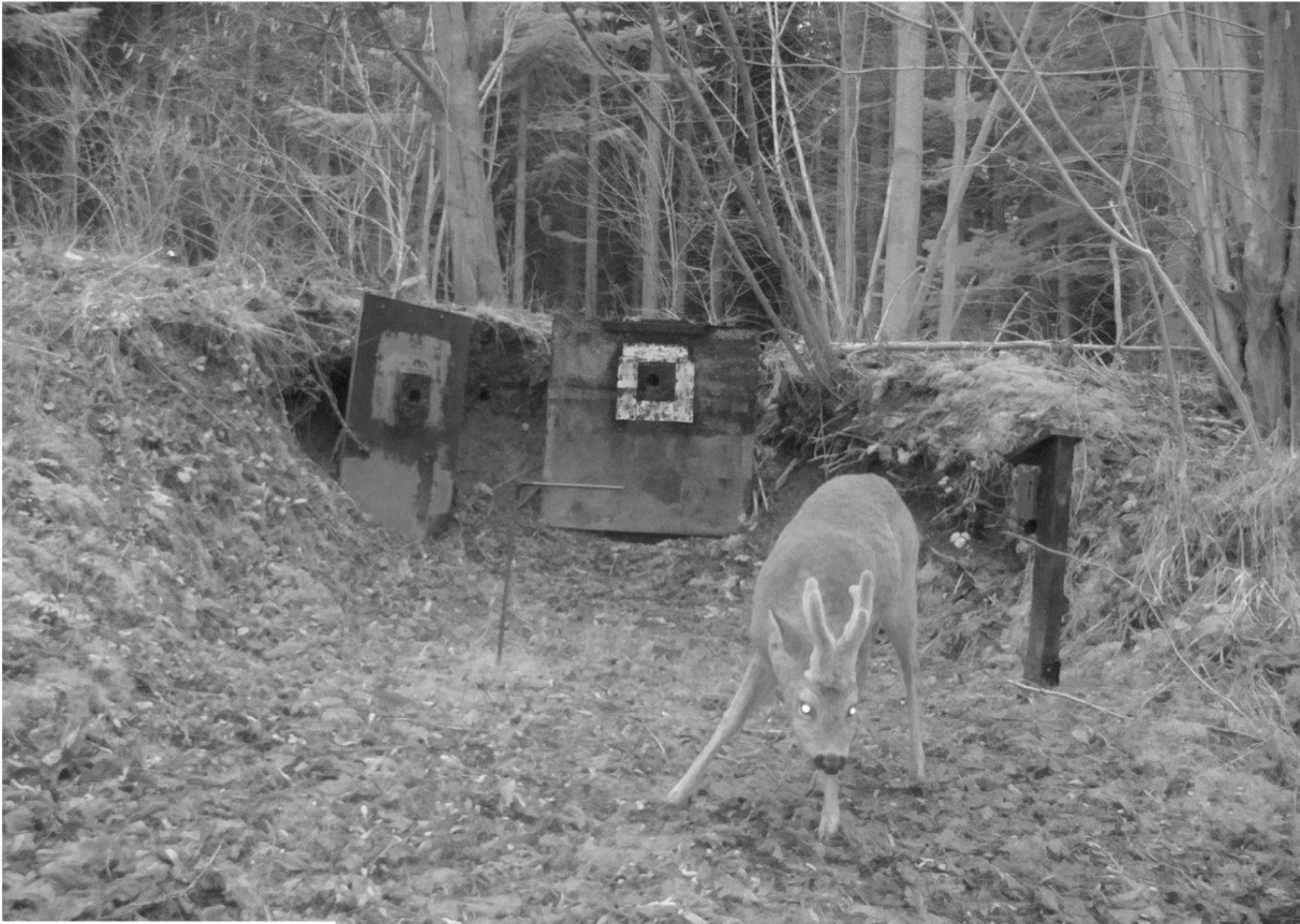
Das Gehörn (Geweih) ist sehenswert.

08:36:30 2024/02/06 7 °C 44 °F ☾ SH STENDER