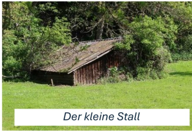
Der kleine Stall

Aus dem Auto auf der Fahrt über den Fuchsberg entdeckte ich, von der Sonne angestrahlt, auf dem Grundstück von Rochusruh einen hölzernen Stall, der mich neugierig machte. War dies ein Überbleibsel der alten Schäferei?